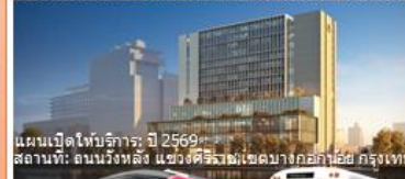
แผนเปิดให้บริการ: ปี 2569 สถานที่: ถนนวังหลัง แขวงศิริราช เขตบางกอก กทม

ช่องทางการติดต่อสื่อสาร ร้องเรียน เสนอแนะการให้บริการ