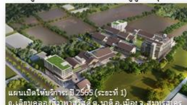
แผนเปิดให้บริการ: ปี 2565 (ระยะที่ 1) ถ. เลียบคลองวิภาวดี สวัสดิ์ ต. นาดอ. เมือง จ. สมุทรสาคร

โครงการศูนย์วิทยาการเวชศาสตร์ผู้สูงอายุระดับชาติ