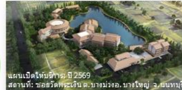
แผนเปิดให้บริการ: ปี 2569 สถานที่: ซอยวัดพระเงิน ต. บางม่วง อ. บางใหญ่ จ. สมุทร