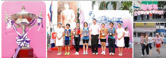
ถ้วยรางวัลเกียรติยศ/ของที่ระลึก