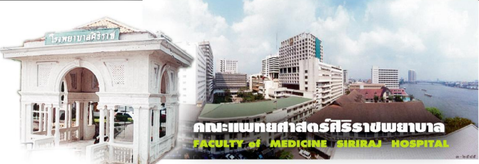
คณะแพทยศาสตร์ศิริราชพยาบาล FACULTY OF MEDICINE SIRIRAJ HOSPITAL

ในอดีตประเทศไทยยังไม่มีโรงพยาบาลถาวร พระบาทสมเด็จพระจุลจอมเกล้าเจ้าอยู่หัว ทรงพระกรุณาโปรดเกล้าฯ ให้ตั้งคอมมิตตีจัดการโรงพยาบาลขึ้น เมื่อวันที่ 22 มีนาคม พ.ศ.2429 เพื่อจัดตั้งโรงพยาบาลสำหรับพระนคร และเมื่อคอมมิตตีจัดการโรงพยาบาลเห็นสมควรให้จัดสร้างโรงพยาบาลขึ้น ณ บริเวณวังกรมพระราชวังบวรสถานพิมุข (วังหลัง) ทางปากตะวันตกของแม่น้ำเจ้าพระยา พระองค์จึงพระราชทานพระราชทรัพย์ส่วนพระองค์เป็นทุนแรกเริ่มในการก่อสร้าง