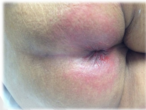
ผิวหนังอักเสบจากการสัมผัสกับอุจจาระและ/หรือปัสสาวะ