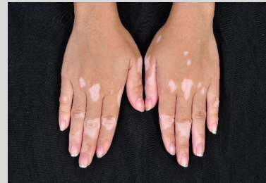
โรคต่างขากระจายทั่วตัว (Non-segmental Vitiligo)

เป็นชนิดที่พบบ่อย พบรอยโรคกระจายทั้งสองด้านของร่างกาย อาจพบรอยโรคบริเวณมือ เท้า ปาก หรือบางรายอาจพบรอยโรคทั่วตัว เป็นชนิดที่มีโอกาสลุกลามมากกว่าชนิดอื่นๆ