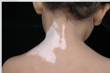
โรคต่างขาเฉพาะที่ (Segmental Vitiligo)

พบรอยโรคอยู่เฉพาะบริเวณใดบริเวณหนึ่งหรือข้างใดข้างหนึ่งของร่างกาย เป็นชนิดที่อาการค่อนข้างคงที่ไม่ลุกลาม