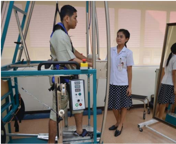
การฝึกเดินด้วยเครื่องฝึกเดิน GT-I

การฝึกด้วย Gait trainer® เหมือนกับ lokomat® ในแง่ของการกระตุ้นให้สมองของผู้ป่วยเรียนรู้รูปแบบการเดินใหม่อีกครั้ง ผู้ป่วยสามารถเดินได้ไกลและนานขึ้นเมื่อผู้ป่วยได้รับการฝึกแล้ว ผู้ป่วยจะมีความทนทานในการออกกำลังกายแบบแอโรบิกเพิ่มขึ้นเหมือนกัน ต่างกันตรงที่ผู้ป่วยที่ฝึกด้วย Gait trainer® จะต้องมีกำลังกล้ามเนื้อ การทรงตัว และสามารถควบคุมการเดินได้ดีกว่า