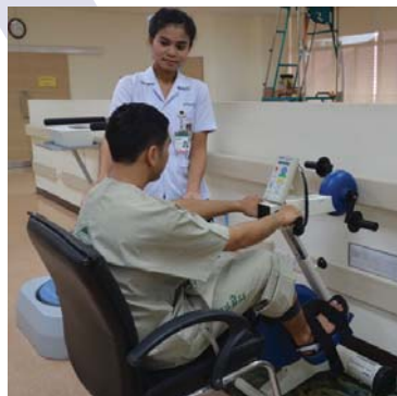
การฝึกประสานสัมพันธ์กล้ามเนื้อขาด้วยการปั่นจักรยาน