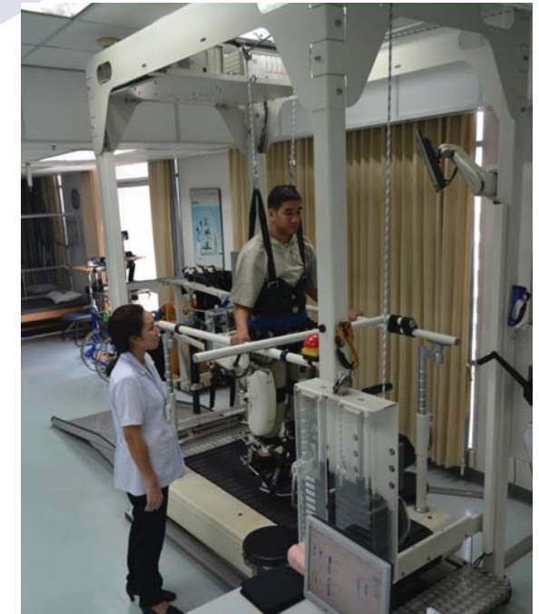
การฝึกเดินด้วย Lokomat ®

เครื่อง Lokomat ® มีลักษณะคล้ายกับลู่วิ่งไฟฟ้าและอุปกรณ์ช่วยพยุงตัว พร้อมกับมีส่วนของหุ่นยนต์ช่วยประคองข้อต่อต่าง ๆ ของสะโพกและขา จึงทำให้เคลื่อนไหวประสานสอดคล้อง ในลักษณะที่เป็นการเดินอย่างต่อเนื่อง และทำทางการเดินใกล้เคียงปกติ เราจึงสามารถนำผู้ป่วยที่ยังเดินและทรงตัวไม่ได้ เช่นผู้ป่วยโรคหลอดเลือดสมองในระยะแรก มาเริ่มฝึกเดินกับเครื่อง lokomat® ได้ ซึ่งจะได้ผลดีในการเพิ่มแรงจูงใจให้ผู้ป่วยเรียนรู้รูปแบบการเดินใหม่ ทำให้ผู้ป่วยกลับไปเดินได้เองใกล้เคียงปกติอย่างรวดเร็ว