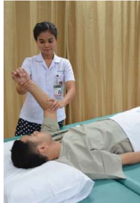
ฝึกให้ผู้ป่วยเคลื่อนไหวข้อต่อ