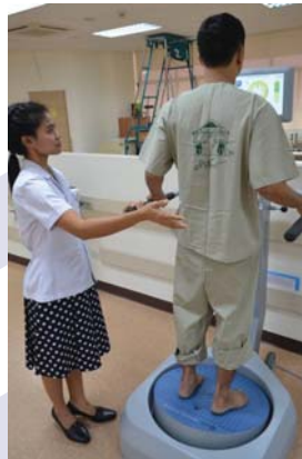
การฝึกด้วยเครื่องฝึกการทรงตัว