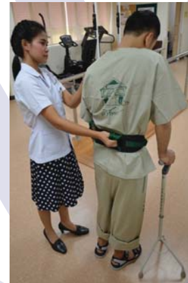
การฝึกเดินด้วยไม้เท้า 3 ขา