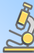
ตรวจพบเชื้อวัณโรคในเสมหะ