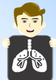
เอ็กซเรย์ปอด