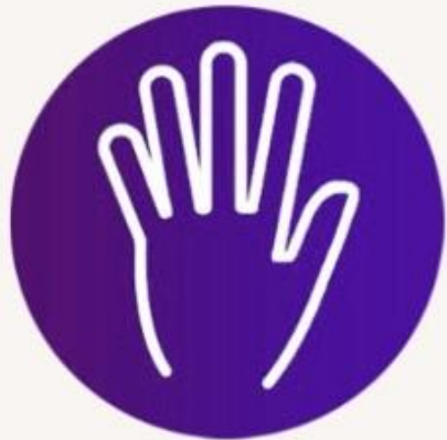
1.หันฝ่ามือออก