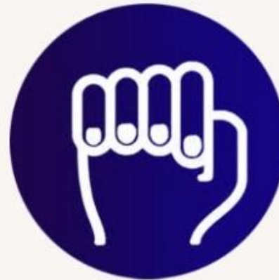
3.พับนิ้วที่เหลือลง ชูค้างไว้ให้นานที่สุด

ใช้บอกว่าคุณกำลังถูกคุกคามหรือเป็นเหยื่อความรุนแรงในครอบครัว