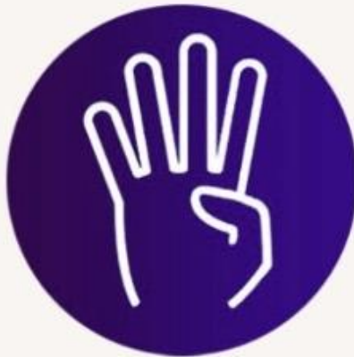
2.พับนิ้วโป้งเหมือนนิ้วเลข 4