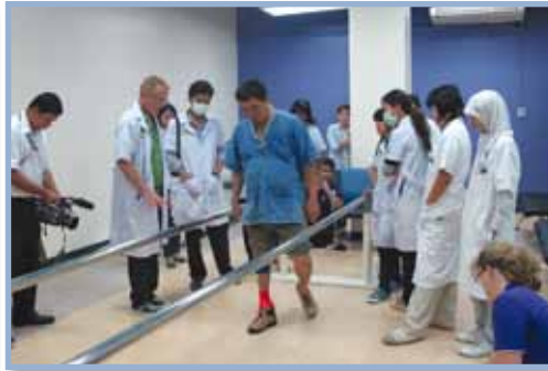
งานประชุมวิชาการที่จัดโดยโรงเรียนกายอุปกรณ์สิรินธร