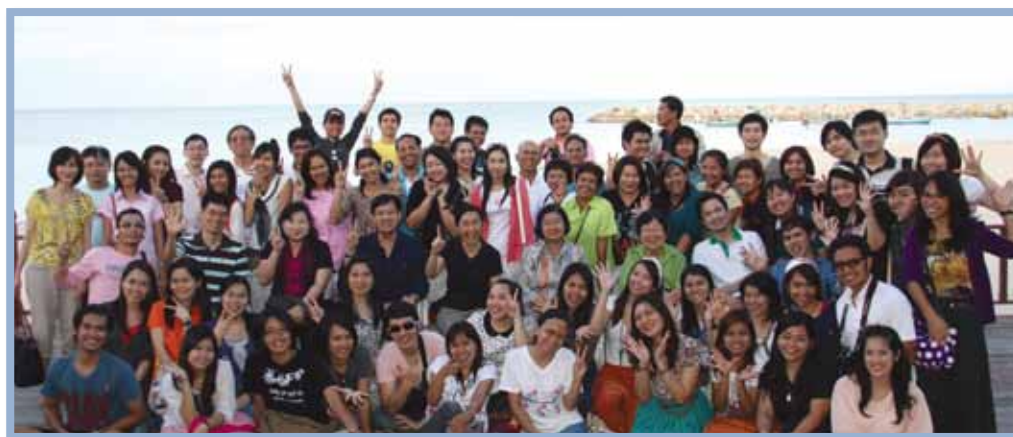
โครงการสัมมนาเพื่อพัฒนาบุคลากร ประจำปี 2555 ระหว่างวันที่ 9 - 11 สิงหาคม 2555 ณ อาคารที่พักสวัสดิการ ทอ.บ่อฝ้าย อ.หัวหิน จ.ประจวบคีรีขันธ์