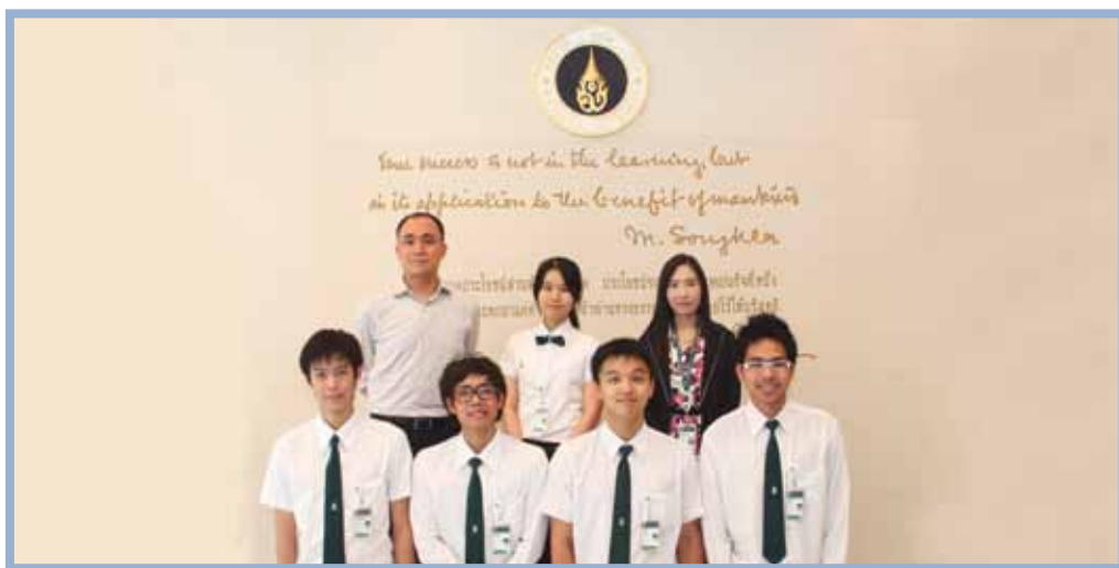
ภาควิชาสรีรวิทยา นำคณะนักศึกษาและคณาจารย์ เข้าร่วมการแข่งขันตอบคำถามทางสรีรวิทยา Inter-medical School Physiology Quiz ณ มหาวิทยาลัยมาลาया ประเทศมาเลเซีย เมื่อวันที่ 29 - 30 สิงหาคม 2555

4) Annual Department Seminar 2012 : Personality development for departmental staff and graduate students