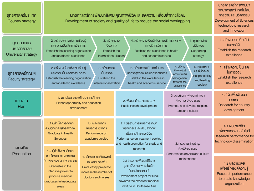
ความเชื่อมโยงระหว่างยุทธศาสตร์ประเทศ ยุทธศาสตร์มหาวิทยาลัยมหิดล ยุทธศาสตร์คณะฯ แผนงานงบประมาณ และผลผลิต Connections between Country Strategy, the University Strategy, the Faculty Strategy, Budget Planning and Productivity

งบประมาณรายจ่ายประจำปีงบประมาณ 2555 ของคณะแพทยศาสตร์ศิริราชพยาบาล รวม 18,209 ล้านบาท จำแนกตามแหล่งเงินที่ได้รับจัดสรร ดังนี้