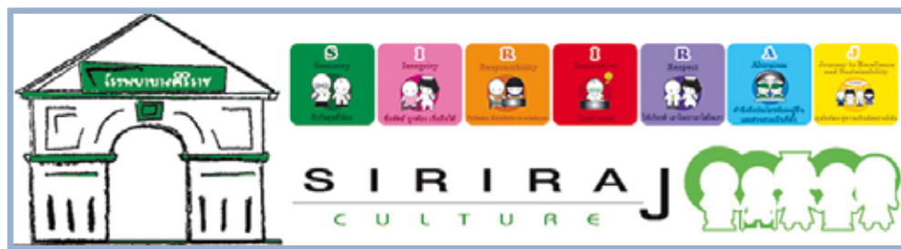
ภาพ Logo การส่งเสริมวัฒนธรรมองค์กร SIRIRAJ Culture Logo of Internalize SIRIRAJ Culture