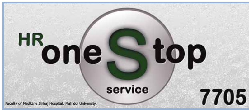
ภาพ Logo โครงการ One Stop Service Logo of One Stop Service