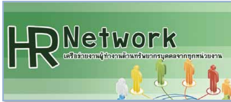
ภาพ Logo โครงการ HR Network Logo of HR Network