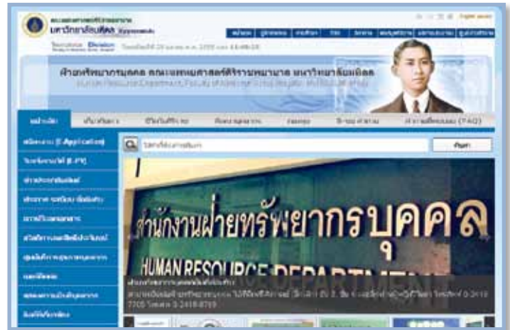
ภาพ Website ฝ่ายทรัพยากรบุคคลที่ปรับปรุงใหม่ Newly Renovated Website of Human Resource Department

จดหมายเหตุรายวันศิริราช 1 - 9 ธันวาคม 2554