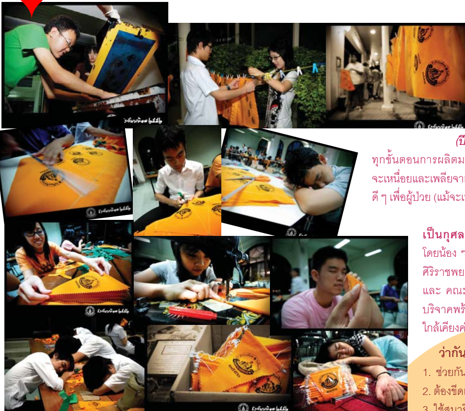
"ทำไป หลับไป ตื่นมานั่งทำใหม่ อ้อของแท้ละนะเนี่ย"