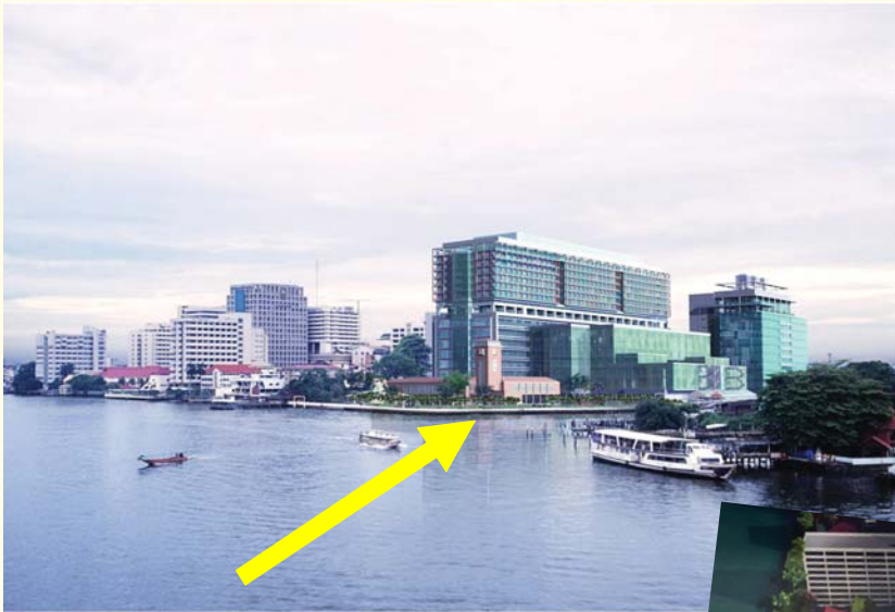
ภาพจำลองแสดงทัศนียภาพที่รายล้อมด้วยต้นไม้เขียวชอุ่มตลอดทางเดินริมน้ำแม่น้ำเจ้าพระยา

“คณะแพทยศาสตร์ศิริราชพยาบาลเป็นสถาบันการแพทย์เก่าแก่ มีอายุถึง 120 ปี ปัจจุบันมีพื้นที่ประมาณ 77 ไร่ อาคาร 70 หลัง บุคลากรประมาณ 12,000 คน ในช่วงเวลาราชการมีประชาชนมาติดต่อรับบริการในพื้นที่ปัจจุบันไม่ต่ำกว่า 40,000 คนต่อวัน