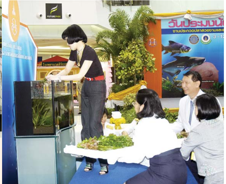
สมเด็จพระเจ้าลูกเธอ เจ้าฟ้าจุฬาภรณวลัยลักษณ์ อัครราชกุมารี และ พระเจ้าวรวงศ์เธอ พระองค์เจ้าโสมสวลี พระวรราชาทินัดดามาตุ เสด็จจัดตู้ปลาไฟพระหัตถ์ เมื่อวันที่ 1 ก.ค.ที่ผ่านมา ณ บริเวณแคสคาต้า (Cascata) ชั้น G ศูนย์การค้าฟิวเจอร์พาร์ค รังสิต