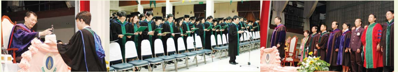
กลับมาเมื่อวันที่ 2 ก.ค.ที่ผ่านมา คณะแพทยศาสตร์ศิริราชพยาบาลจัดพิธีมอบใบอนุญาตประกอบวิชาชีพเวชกรรมและปริญญาตนของบัณฑิตแพทย์ศิริราช รุ่น 114 ณ หอประชุมราชแพทยาลัย...ได้เห็นรอยยิ้มจากคุณหมอรุ่นใหม่หัวใจแกร่งเหล่านี้ มันใจได้เลยว่าประเทศไทยจะมีแพทย์ที่ดีทั้งฝีมือและเปี่ยมคุณธรรมออกไปรับใช้สังคมแน่นอนค่ะ