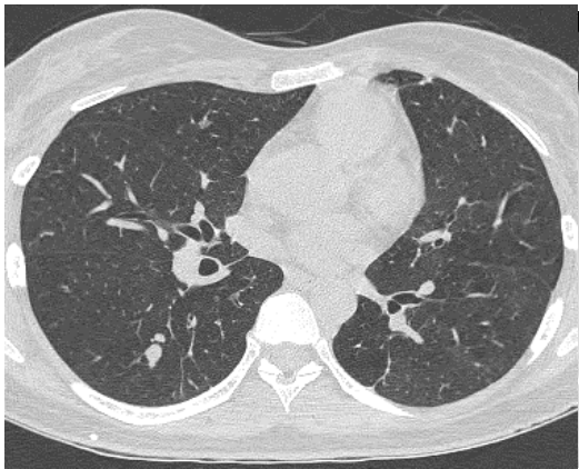
ปอดคนปกติ

การรักษาโรคปอดที่เป็นหัวใจ คือ การป้องกันไม่ให้เกิดโรค หากเป็นโรคปอดที่เกิดจากการติดเชื้อ สิ่งที่สำคัญคือการรักษาสุขภาพทั่วไปให้แข็งแรง ไม่เข้าไปในที่ที่คนอยู่กันอย่างแออัดเป็นเวลานาน และฉีดวัคซีนป้องกันไข้หวัดใหญ่ทุกปี และเมื่อมีข้อบ่งชี้ก็ควรฉีดวัคซีนป้องกันเชื้อนิวโมคอคคัสเพื่อลดโอกาสเกิดปอดอักเสบจากเชื้อนี้ ส่วนโรคปอดที่ไม่ได้เกิดจากการติดเชื้อที่สำคัญ คือ ระวังพฤติกรรมสุขภาพที่อันตรายโดยเฉพาะการสูบบุหรี่