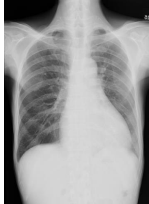
ปอดที่เป็นถุงลมโป่งพอง

แต่ส่วนที่สำคัญที่เราตัดแปลงได้ คือพฤติกรรมสุขภาพ ได้แก่ การสูบบุหรี่ การสัมผัสฝุ่น ควัน และก๊าซ โดยเฉพาะตัวการร้ายที่กำลังคุกคามประชากรไทยและประชากรโลกอย่างหนักขณะนี้ คือ ฝุ่น PM 2.5