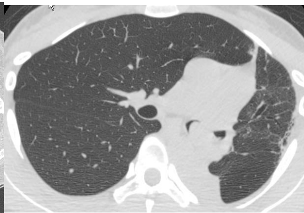
ปอดคนสูบบุหรี่

สำหรับไวรัสโรคปอด ที่ยังเป็นปัญหาสำคัญของประชากรไทยและประชากรโลก โดยเฉพาะถ้าเกิดร่วมกับการติดเชื้อเอชไอวี ปัจจุบันมีการตรวจวินิจฉัยที่ทำได้รวดเร็วและแม่นยำ และมียาที่รักษาได้อย่างมี