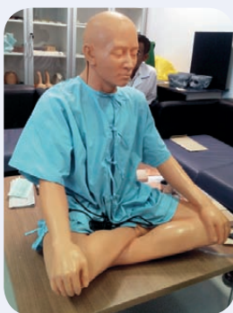
หุ่นจำลองที่มีระบบเซนเซอร์