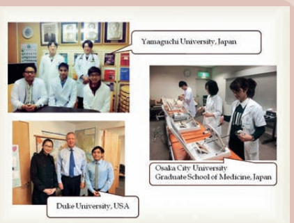
Yamaguchi University, Japan