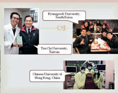
Kyungpook University, South Korea