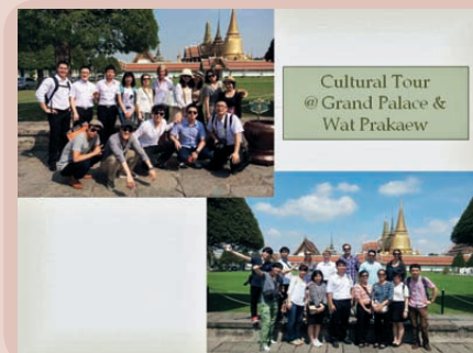
Cultural Tour @ Grand Palace & Wat Prakaew