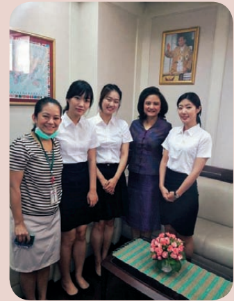
Kyungpook National University